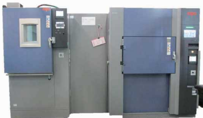
メーカー名：エスペック(株) 型式：TSAHRG-203ES300306H

半導体の動作温度の上昇や電子部品の実装方法・鉛フリー化などに対応した電子機器の信頼性評価試験方法に使用。